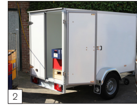
2 Optie: enkelassige koelwagens tot 1800 kg bruto laadvermogen, afmeting tot en met maximaal 300 x 150 x 210 cm.