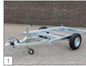
1 Standaard: gelast en volbad verzinkt onderstel voor enkelasser.