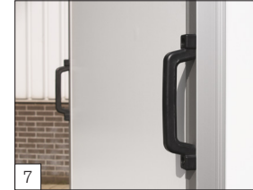
7 Standaard: 2 handgrepen aan de voorzijde.