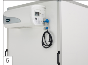
5 Standaard: koelunit 230/50Hz met een capaciteit van 1600W/2°C aan de versterkte voorzijde inclusief verlengkabel.