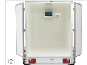
12 Standaard: wanden met gelcoat, dak en vloer 40 mm geïsoleerd.