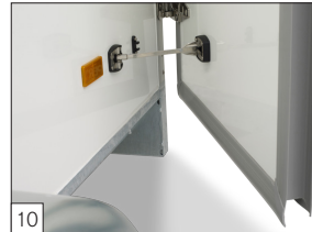
10 Standaard: geïsoleerde deuren 40 mm dik, voorzien van gelcoat.