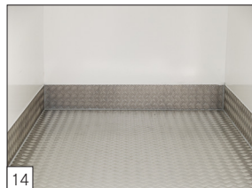
14 Optie: aluminium tranenplaat en stootrand gemonteerd.