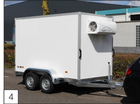
4 Optie: dubbelassige koelwagens tot 3500 kg bruto laadvermogen, afmeting tot en met maximaal 400 x 180 x 210 cm.