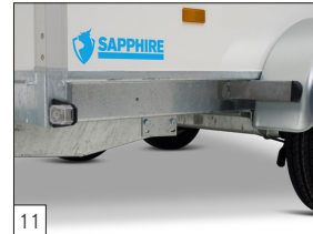
11 Standaard: spatbordsteunen gemonteerd voor bevestiging spatborden.