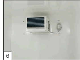
6 Standaard: koelgedeelte aan de binnenzijde inclusief binnenverlichting.