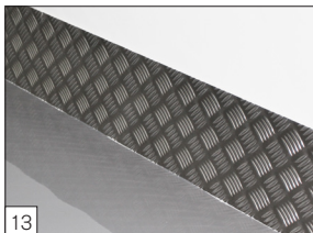
13 Optie: speciale gietvloer coating op de vloer en aluminium stootranden.