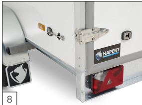
8 Standaard: RVS scharnieren en bevestigingsmateriaal.