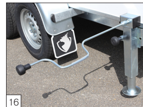
16 Optie: zware uitzetsteunen (draaibaar en verstelbaar) inclusief slinger.