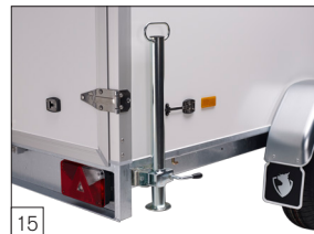
15 Optie: schuif-steunpoten gemonteerd.