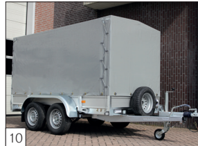
Optie: huif gemonteerd en reservewiel met steun aan voorzijde.