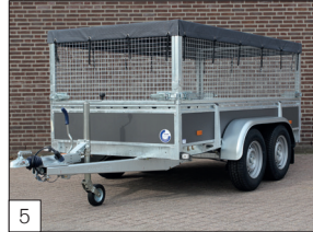
Optie: gaasrekwerk 75 cm hoog (afneembaar) en een fijnmazig ladingnet (gemonteerd).