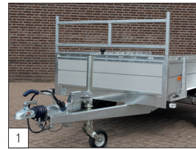
Standaard: uitneembaar voorrek.