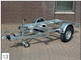
Optie: model L-1 'Chassis', leverbaar als geremde en ongeremde uitvoering.