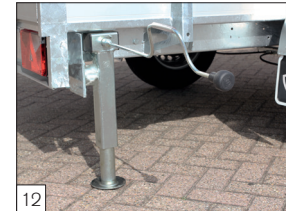
Optie: verstelbare en draaibare uitzetsteunen en voorzien van afneembare slinger.