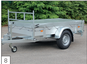
Optie: vlak zeil gemonteerd (kleur grijs).