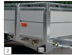
Optie: schroefbare haken aan de buitenzijde.