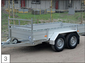
Optie: spatborden van aluminium tranenplaat.