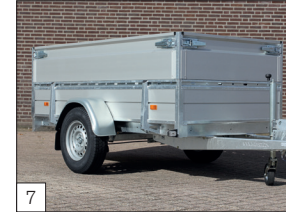
Optie: afneembare aluminium opzetborden ca. 40 cm hoog voorzien van degelijke sluitingen.