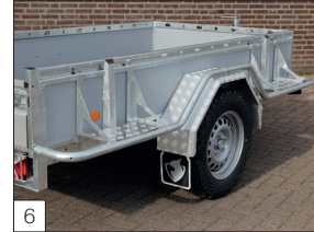
Optie: afschermbuigels voor, boven en achter de spatborden (uit één stuk), voorzien van aluminium opstap. Spatborden van aluminium tranenplaat.