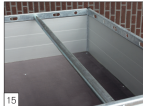
Optie: spanbuis gemonteerd.