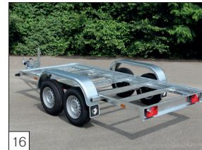
Optie: model L-2 'Chassis', als extra optie is o.a. een multiplex vloerplaat mogelijk.