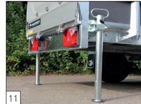
Optie: schuifsteunpoten met klembeugel gemonteerd.