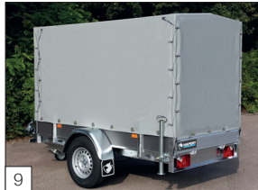
Optie: huif gemonteerd, verschillende hoogtes mogelijk met steunpoten incl. schuifklem gemonteerd.