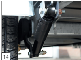
Optie: schokbrekers op de as(sen) gemonteerd.