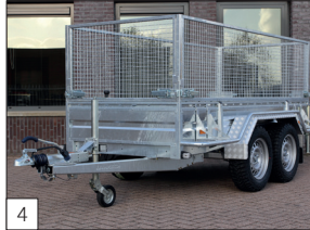
Optie: gegalvaniseerde stalen borden, robuuste ALU-spatborden, afneembaar gaasrekwerk en afschermbuigels uit één stuk gemonteerd.